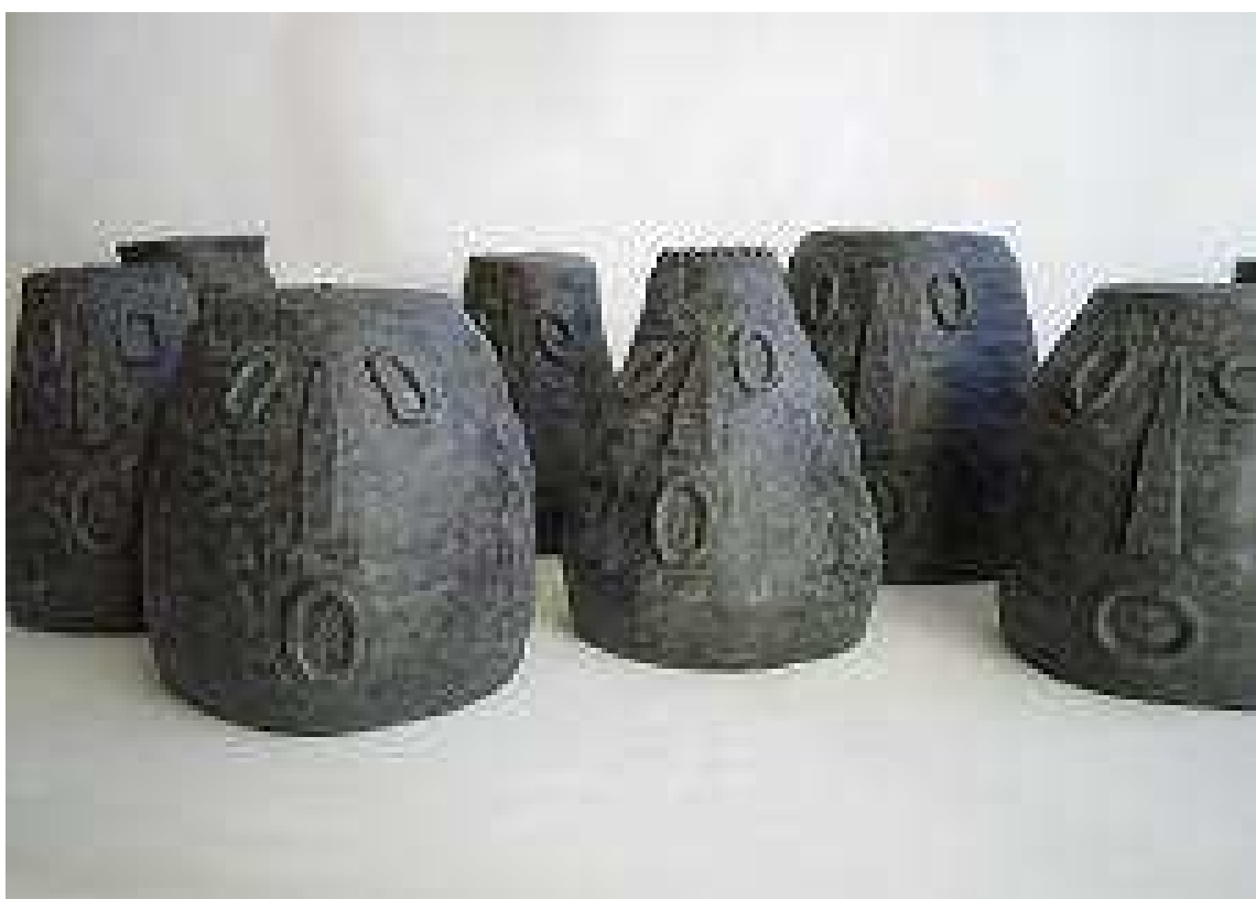
Una finestra al mar

És una escultura subjectiva, dels sentiments, en la qual a més d'una perfecta realització tècnica, es traspasa la barrera dels nostres sentits i ens porta al món dels nostres records, però no simplement amb la tasca d'enyorar temps millors, més humans; no és un art de la resignació, és un art de la lluita contínua, de reivindicació, en suma d'esperança. Observar les seves escultures produeix la mateixa sensació que obrir una finestra de cara a la mar i deixar que la brisa ens refresqui la ment. És un art que renova el panorama de l'escultura actual, amb aire fresc, combatiu i sobretot esperançador.