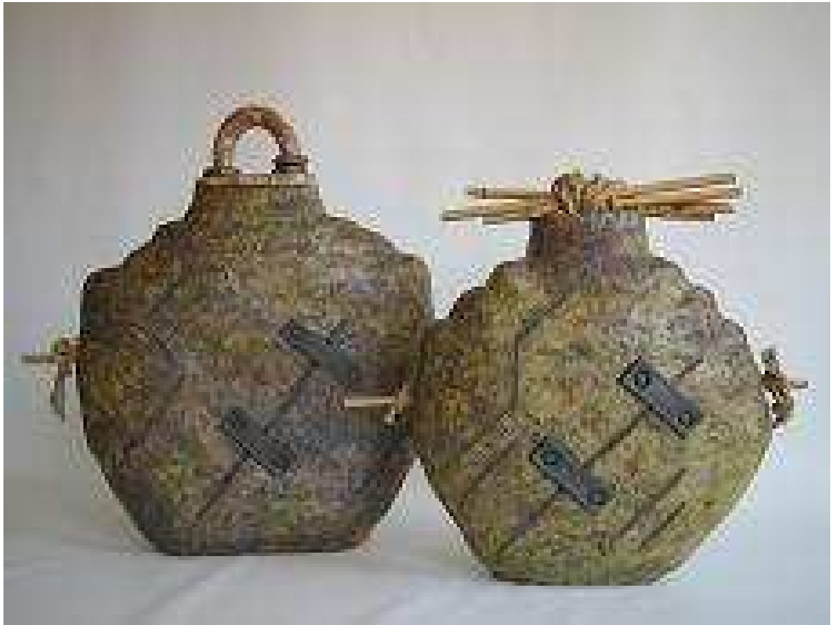
Una finestra al mar