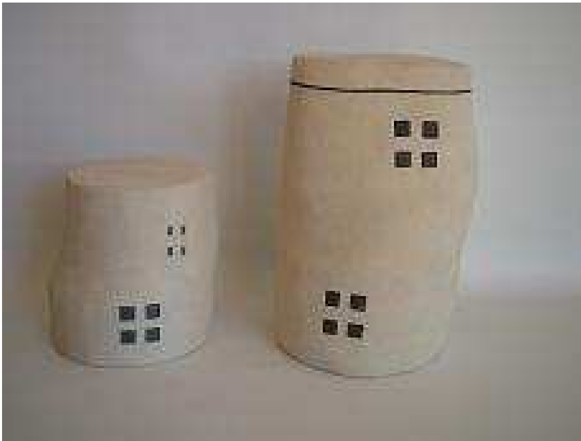
Una finestra al mar

El coneixement tècnic és indispensable per a la recerca del seu llenguatge personal. La tècnica s'aprèn, però no és prou per a fer creacions que, a més de posseir el concepte subjectiu de bellesa, ens transmeten una idea, un contingut, en última instància un objectiu. Guzmán ho aconsegueix.