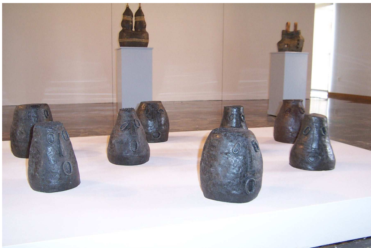
Una finestra al mar