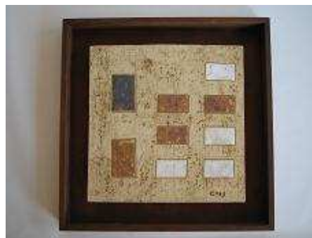
Una finestra al mar