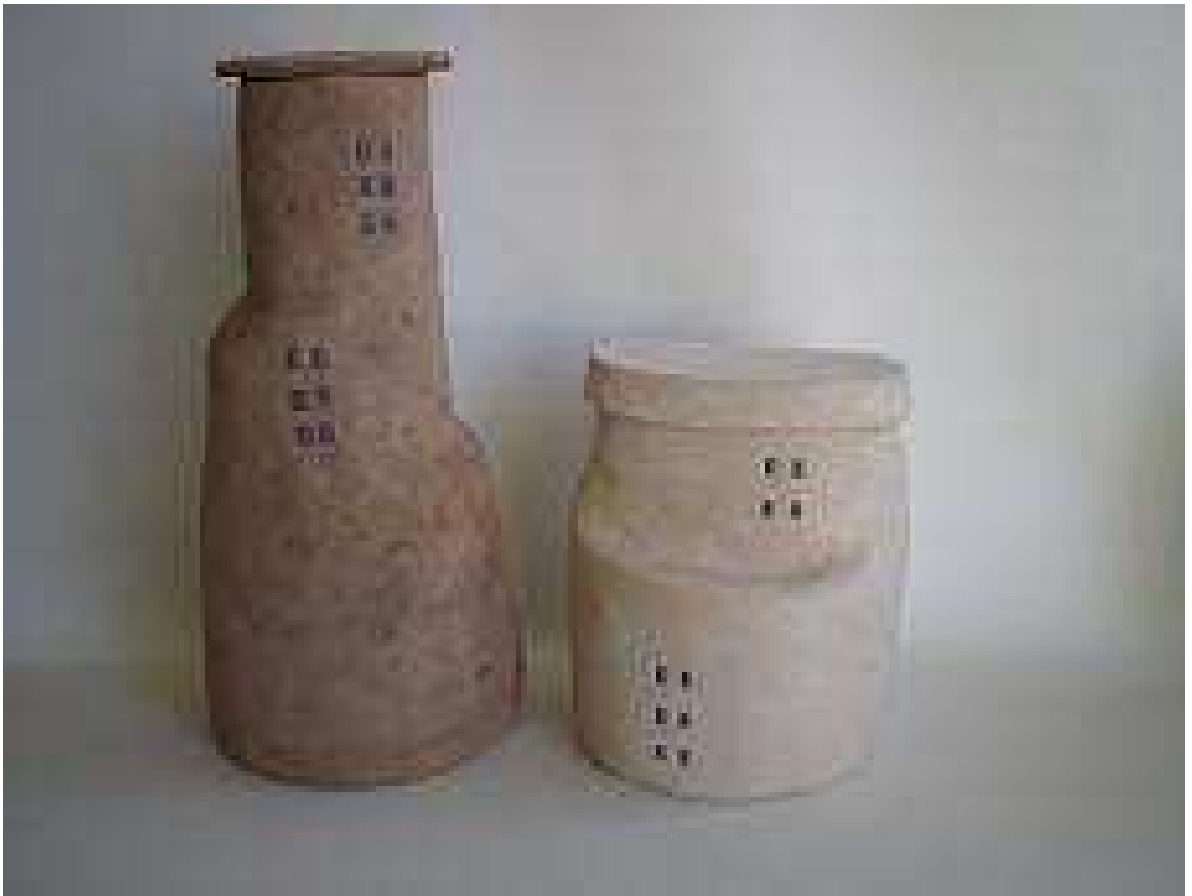
Una finestra al mar