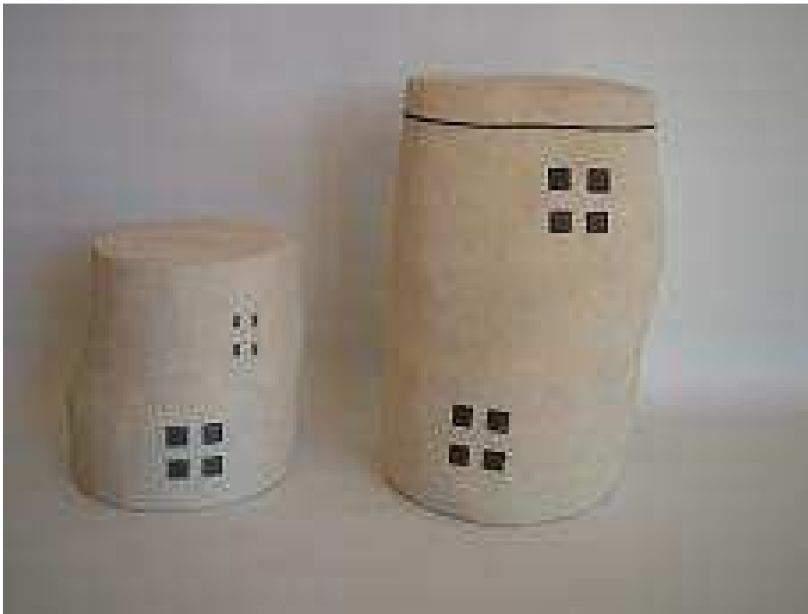
Una ventana al mar